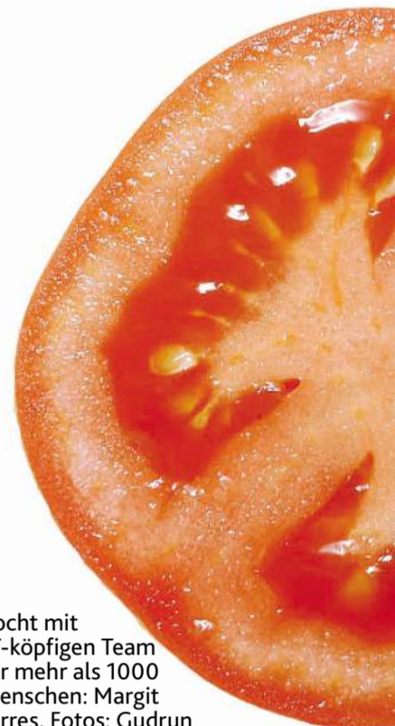
Kocht mit 17-köpfigem Team für mehr als 1000 Menschen: Margit Jörres.