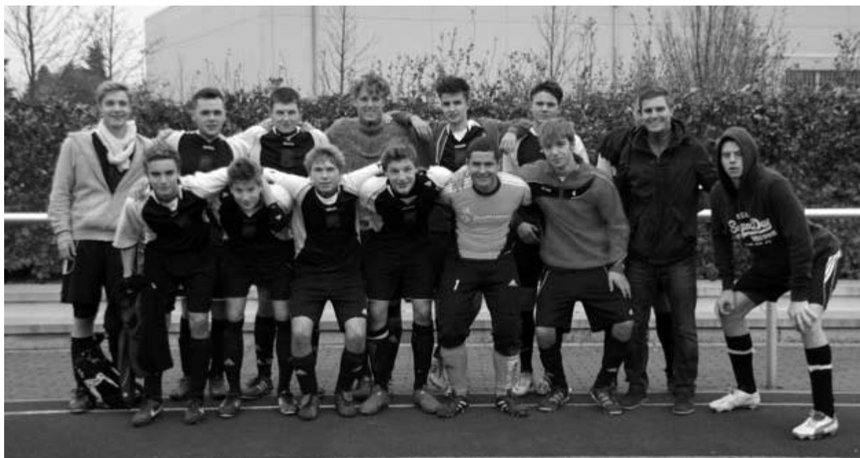
Unsere Schulmannschaft Fußball Wettkampfklasse I von links nach rechts:

Die Fußball-Schulmannschaft der Wettkampfklasse I (Geburtsjahrgänge 1993 bis 1997) hat durch zwei Siege in zwei Spielen die Vorrunde souverän überstanden und steht nun im