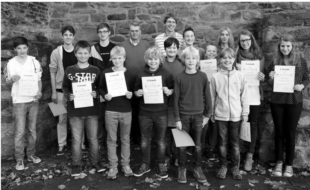
Die diesjährigen Preisträger der Mathematik-Olympiade