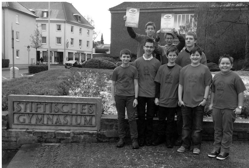
Das Stift.-Team wurde im Roboterwettbewerb ausgezeichnet

Am 24. November 2012 nahm das Stiftische Gymnasium zum dritten Mal in Aachen am Roboterwettbewerb „FIRST® LEGO® League“ teil, der dieses Mal unter dem Motto „Senior Solutions“ stand.