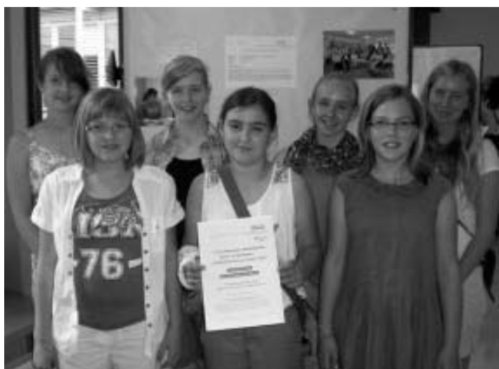
Die stolzen Preisträgerinnen des Dürener ABC-Wettbewerbs

Eingebunden war das Pilot-Projekt in die ABC-Wettbewerbsinitiative „AusBildungsChancen Düren“ in Trägerschaft von „Jugendstil - Kinder- und Jugendliteraturzentrum NRW“. Am