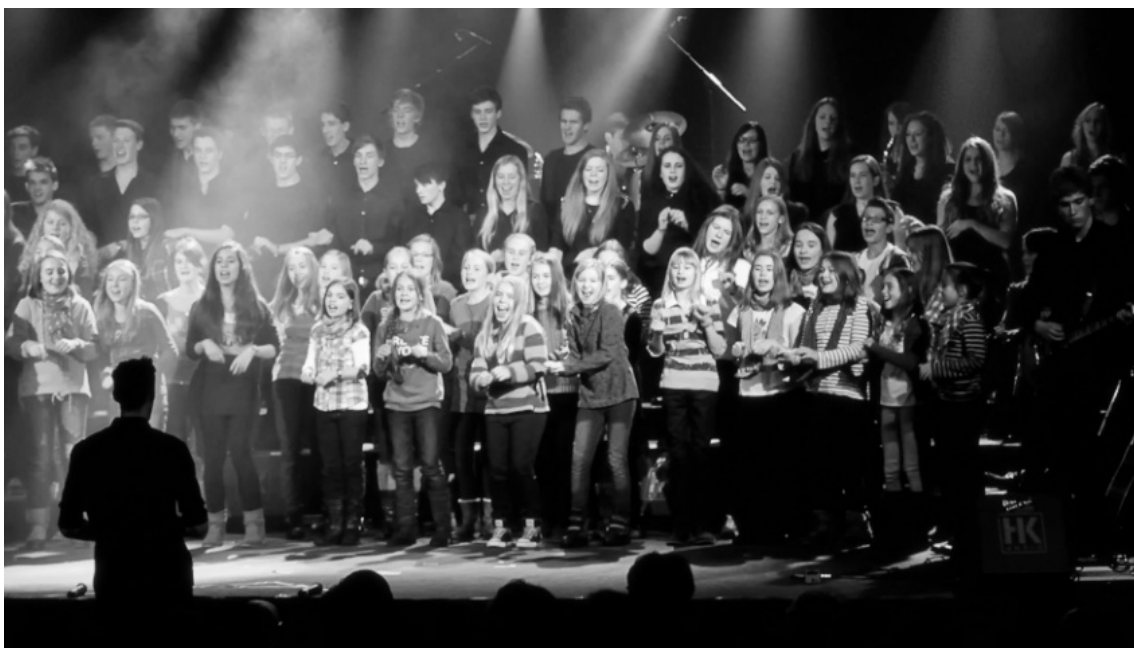
Der Unterstufenchor singt kräftig mit beim IP-Konzert

Unter diesem Motto standen die diesjährigen Konzerte des instrumentalpraktischen Kurses der Jahrgangsstufe Q2 am 07. und