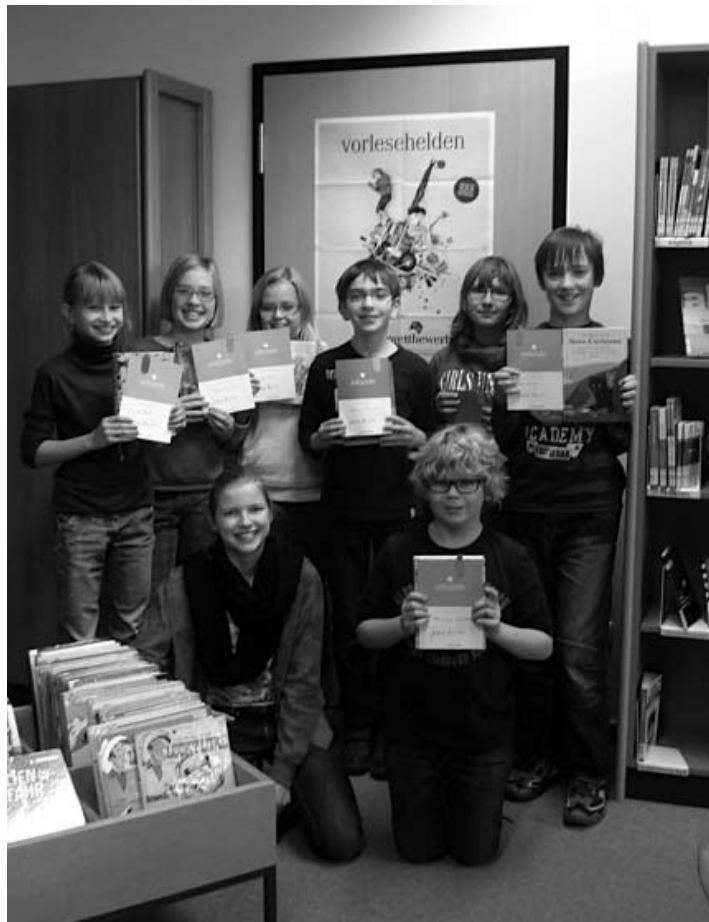
Die „Vorlesehelden“ 2012