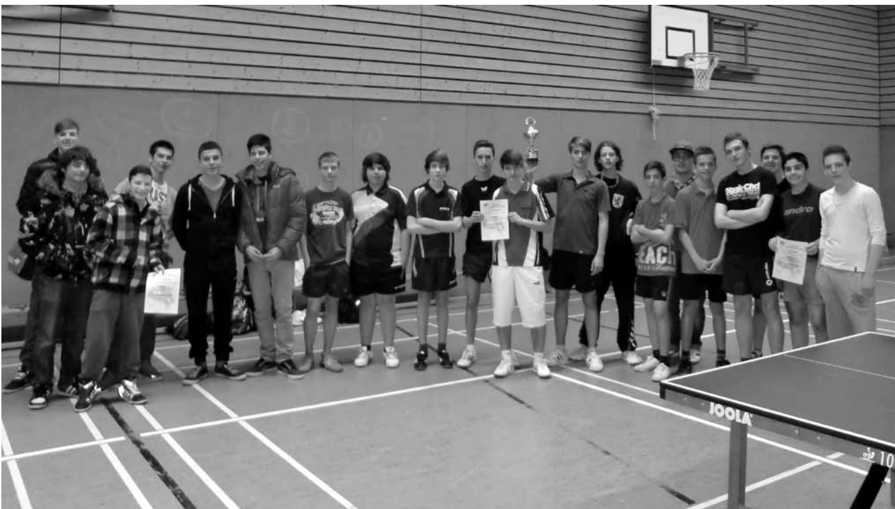
Siegerehrung bei der Kreismeisterschaft

Team und Betreuer freuen sich bereits jetzt auf die erneute Möglichkeit, sich für die Landesmeisterschaft qualifizieren zu können, verpasste man diesen Sprung im letzten Jahr nach neun gespielten Spielen mit insgesamt 41 Sätzen nur denkbar knapp um drei einzelne Ballwechsellpunkte.