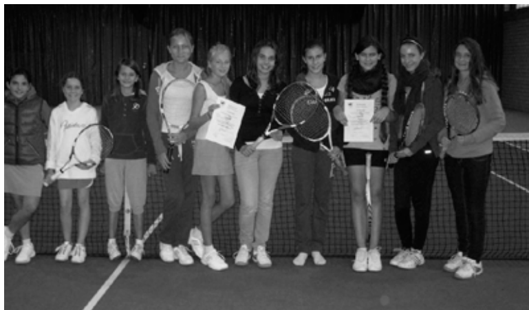
Die Mädchenmannschaften vom Stift. und vom GaW

Platz vier im Finale für Europameisterin Ulla Schwab. Nach Deutschland-Cup nächste Woche steht Weltmeisterschaft vor der Tür.