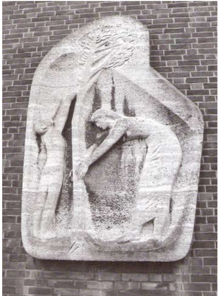
Das „Lebensbaum“-Relief von Adolf Wamper (1954) am Aula-Eingang

nen Dozenten, dem 1970 vom Land Nordrhein-Westfalen anlässlich seiner Verabschiedung der Professorentitel verliehen wurde, ist allerdings in dieser Form nicht vollständig: Während der Zeit des Nationalsozialismus war Adolf Wamper auch mit (Auftrags-)Arbeiten hervorgetreten, die der NS-Kunstauffassung voll entsprachen. Ob bei der Vergabe der Aufträge für die in Düren geschaffenen Kunstwerke („Lebensbaum“-Relief an der Aula des Stiftischen Gymnasiums und